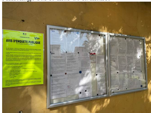
Affichage sur le mur de la mairie