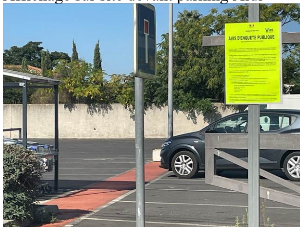
Affichage sur le parking Aldi