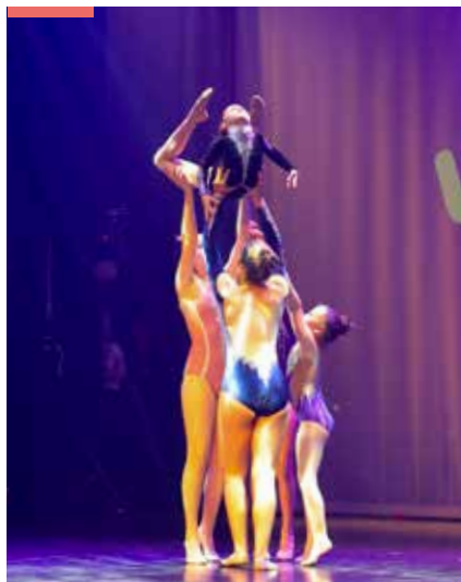
P.24 SPORT Grand Défi Vivez Bougez !