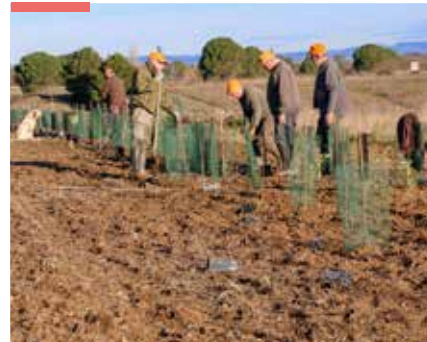
P.20 ÉCOLE Sensibilis'haie