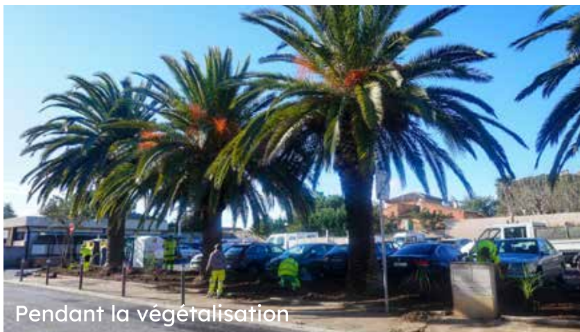
Pendant la végétalisation