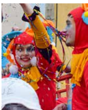
RETOUR EN IMAGES Carnaval 2026