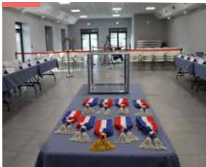
P.12 VIE MUNICIPALE Nouvelle équipe municipale