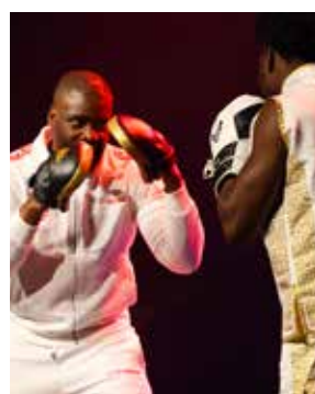
SPORT Grand défi vivez bougez