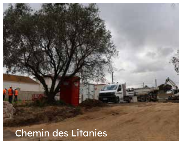
Chemin des Litanies