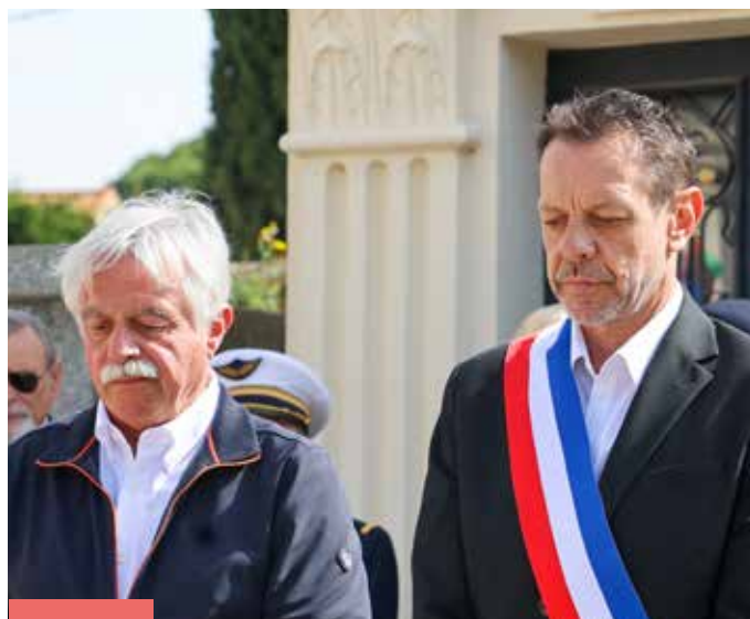
Cérémonie commémorative 11 avril 2026