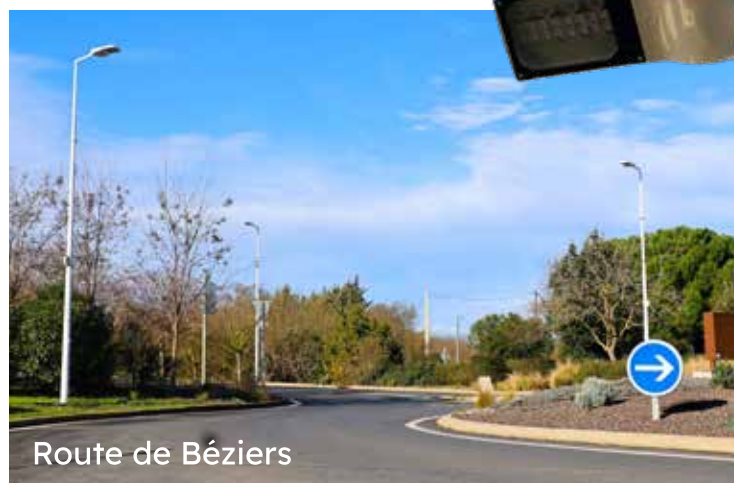
Route de Béziers