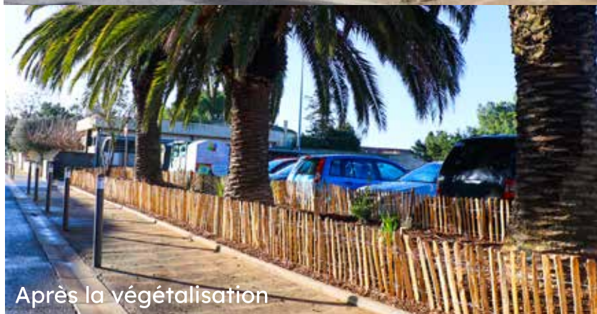
Après la végétalisation