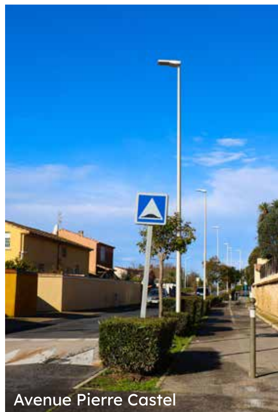
Avenue Pierre Castel

Par ailleurs, le réaménagement du chemin des Litanies se poursuit avec la création de stationnements, d'aménagements paysagers, de cheminements piétons et une circulation repensée pour faciliter les déplacements.