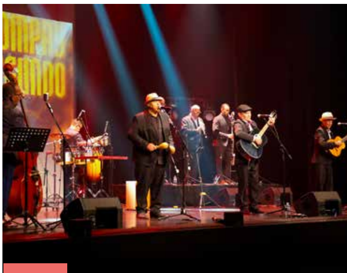
Grupo Compay Segundo 27 mars 2026