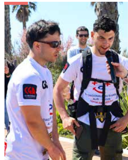
P.31 ACTUALITÉS Cap sur Vias "La diagonale du sourire"