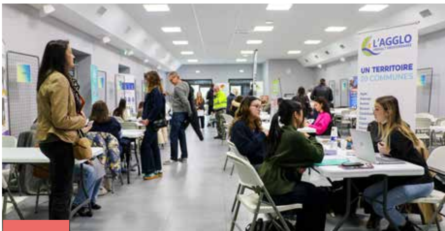
Forum de l'emploi saisonnier 27 février 2026