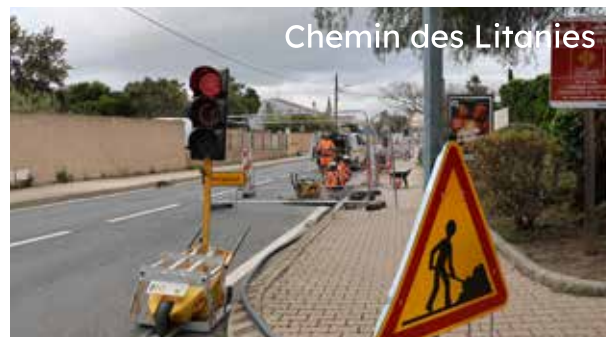
Chemin des Litanies