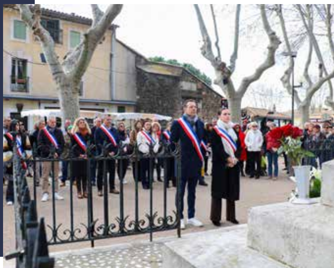
Dépôt d'une gerbe au Monument aux Morts

L'Assemblée délibérante a ensuite procédé à l'élection de 8 adjoints au Maire, qui seront épaulés dans leurs missions par des conseillers municipaux délégués.