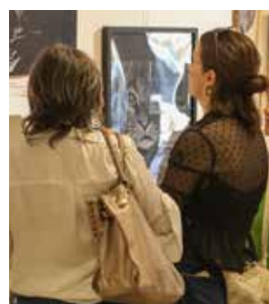
CULTURE Nouvelle saison à la Galerie d'Art