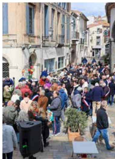
Apéritif offert par la nouvelle Municipalité