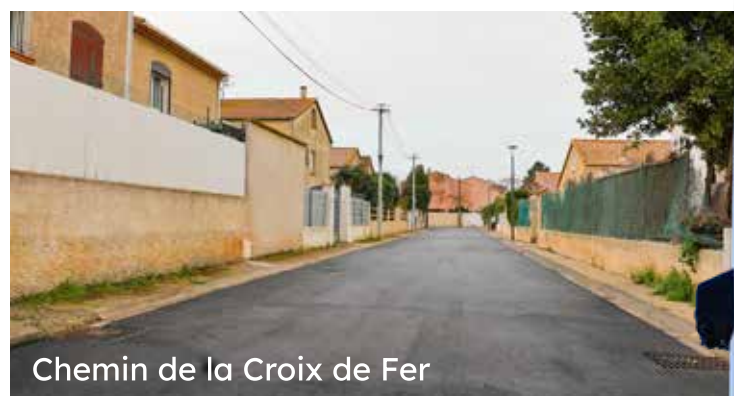
Chemin de la Croix de Fer