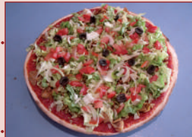
Pizza kebab salade