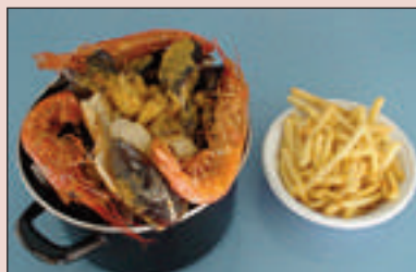
Marmite du pêcheur